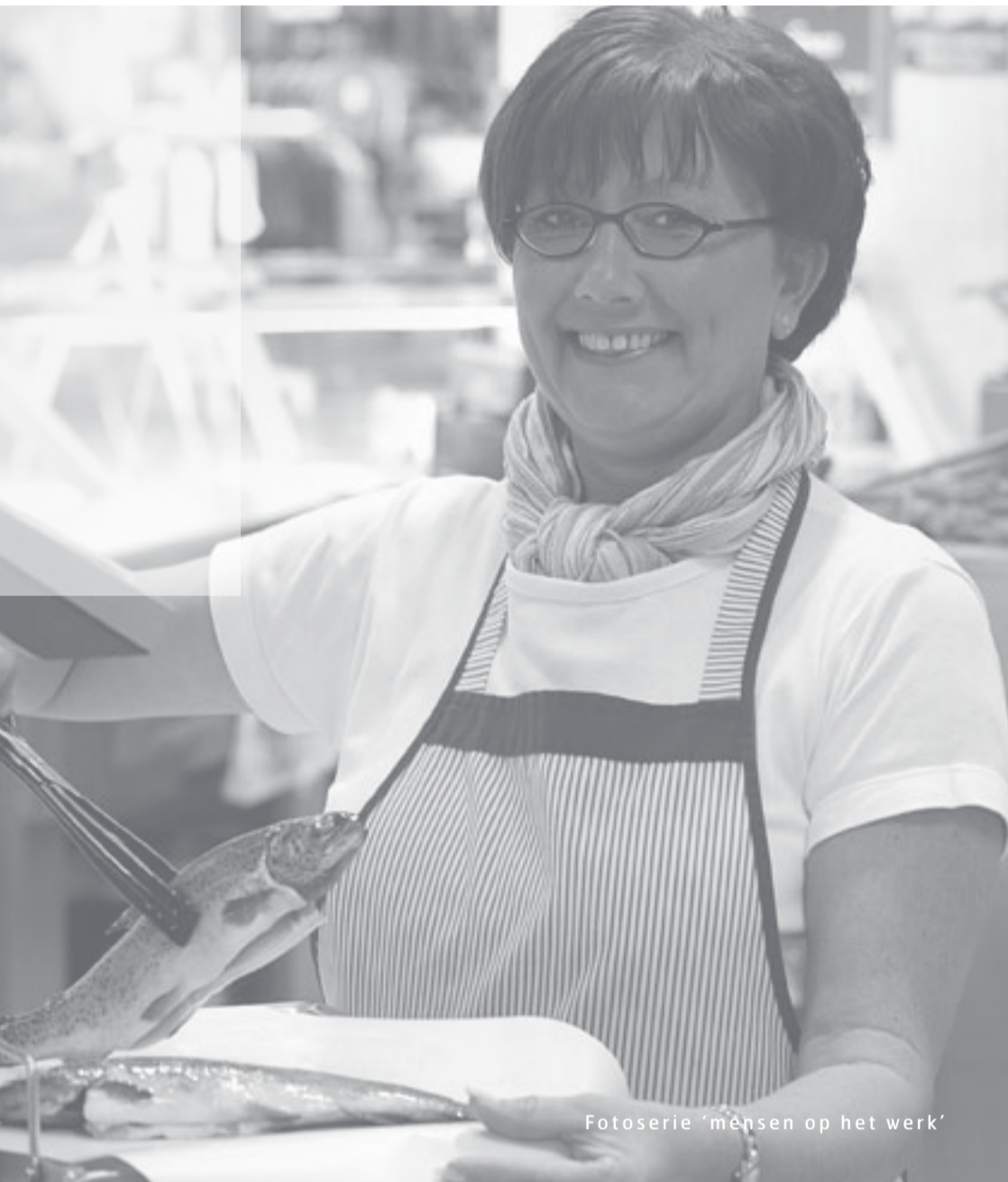
Fotoserie 'mensen op het werk'