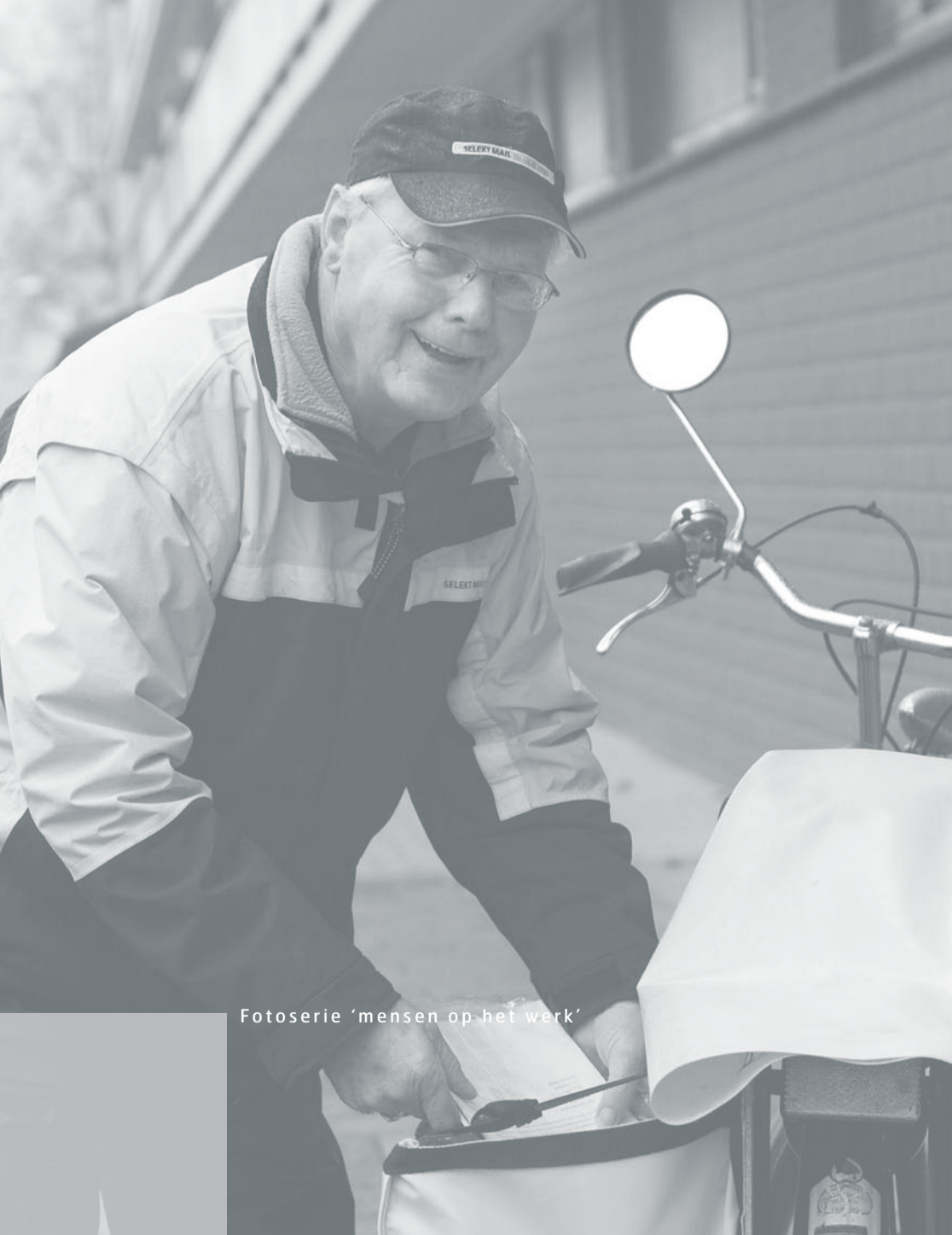
Fotoserie 'mensen op het werk'