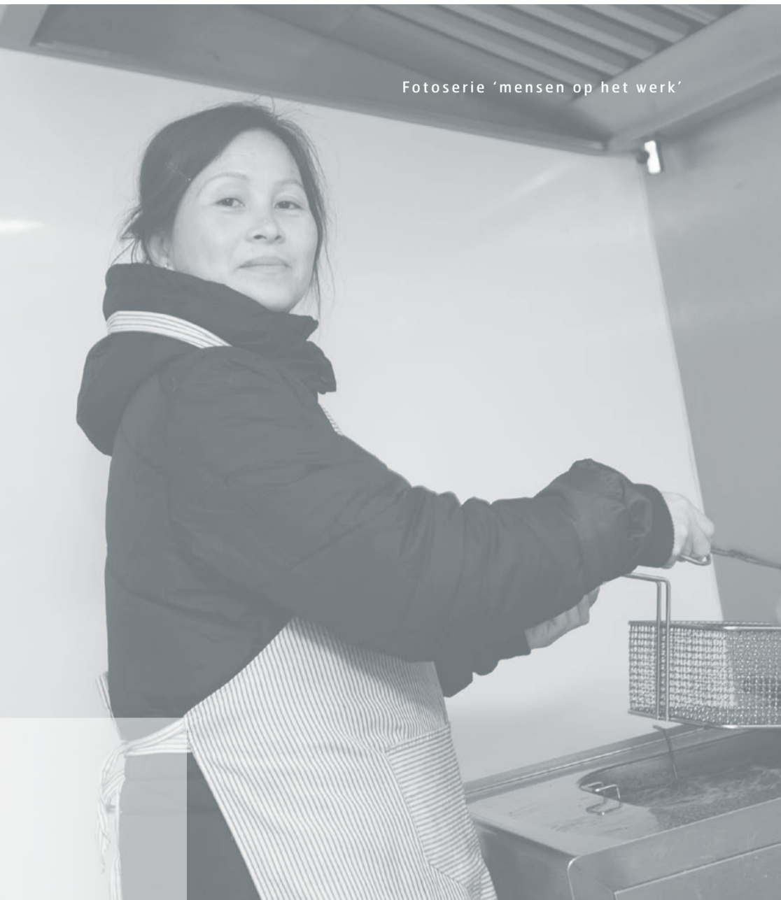
Fotoserie 'mensen op het werk'